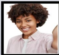
Selfie ou rosto não centralizado