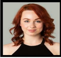
Fundo colorido ou com paisagem