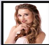
Rosto não centralizado