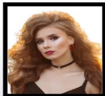
Rosto não centralizado