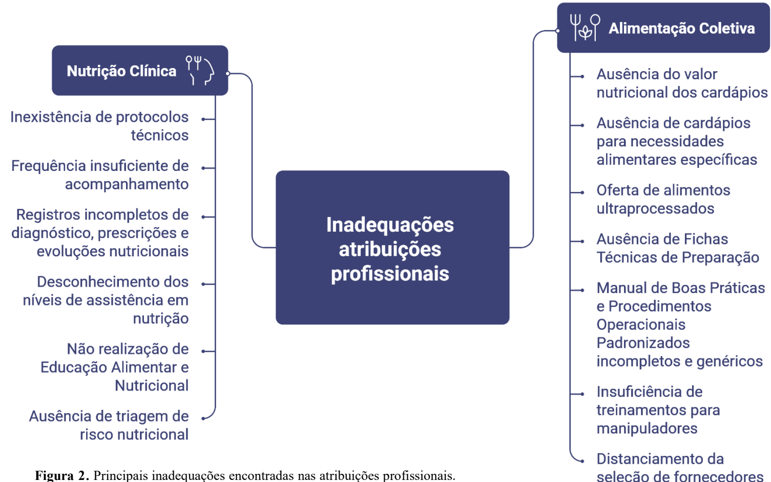
Figura 2. Principais inadequações encontradas nas atribuições profissionais.

Foi observado que, independentemente da carga horária exercida no local, o cumprimento das atribuições profissionais obrigatórias era insuficiente ao estabelecido pelo CFN, bem como era frequente o número de profissionais com mais de uma anotação de responsabilidade de ILPI no município.